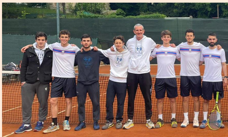
Serie C maschile