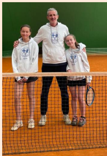
Under 14 femminile