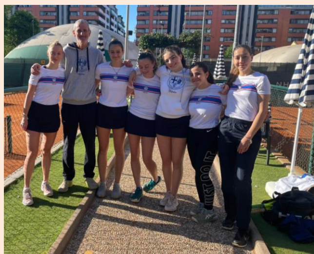
Serie C femminile