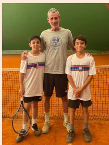
Under 14 maschile